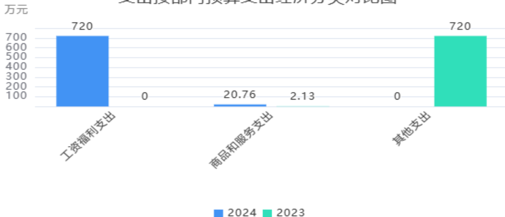
支出按部门预算支出经济分类对比图