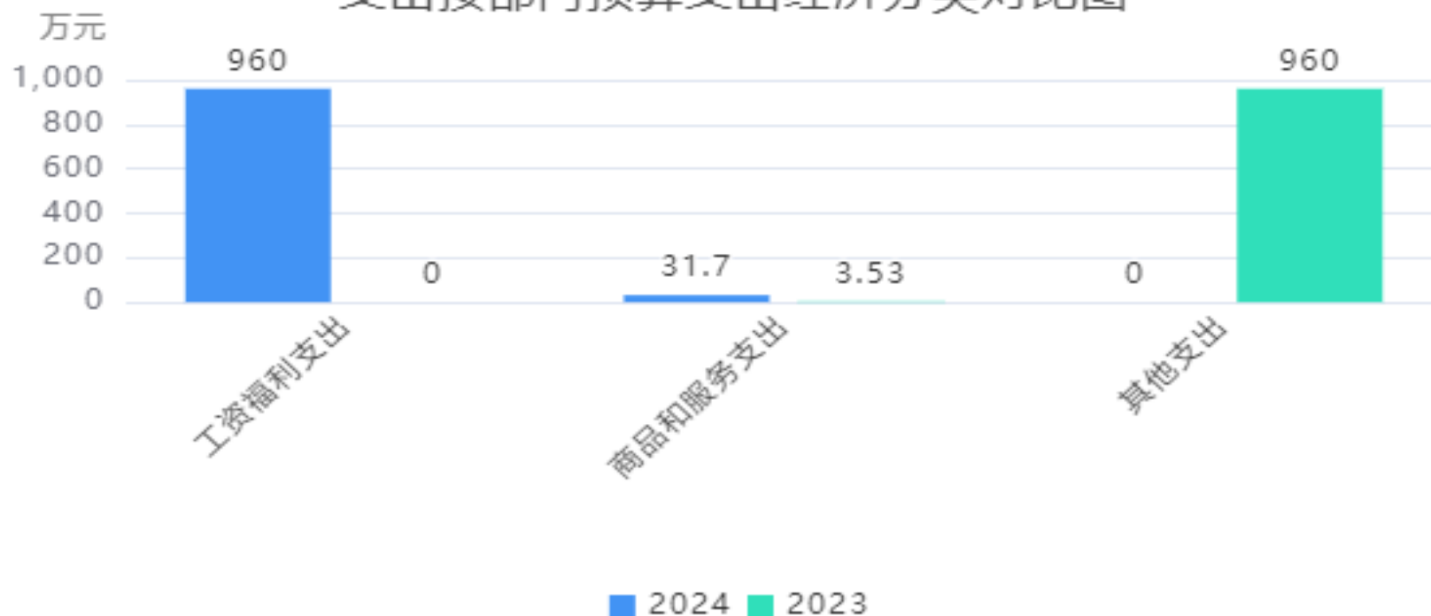
支出按部门预算支出经济分类对比图