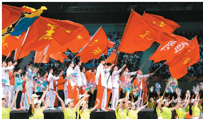
执旗手在闭幕式上挥舞各体育代表团旗帜。

闭幕式上,赵一德将全运会会旗交给苟仲文,苟仲文将会旗移交给作为第十五届全运会承办单位代表的广东省省长马兴瑞、香港特别行政区行政长官林郑月娥、澳门特