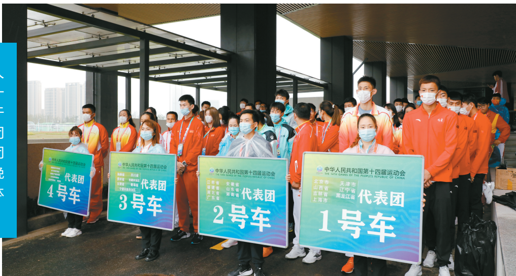
运动员等待前往闭幕式现场。

中华人民共和国第十四届运动会于27日圆满闭幕，盛大的闭幕式于当天晚间在西安奥体中心举行。