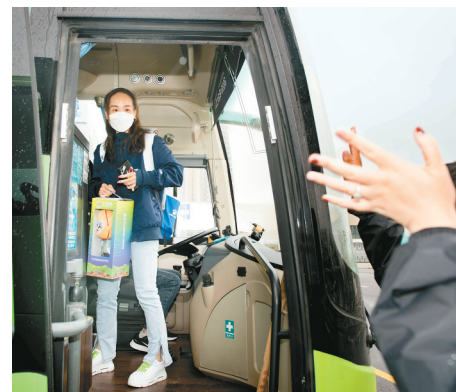
技术官员抵离中心，工作人员送别最后一名技术官员。