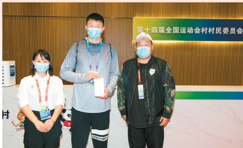
村委会为运动员临时提供了一部手机,解决了燃眉之急。